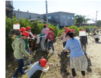
全校クリーン活動