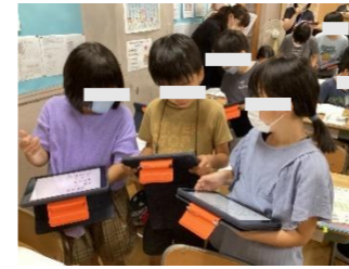
まなびi岩小スタイルの充実