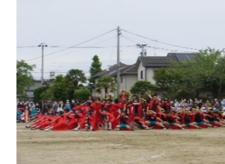
体づくりと外遊びの推進