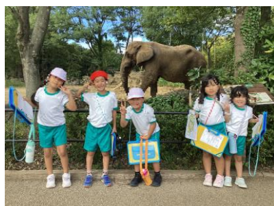
1年生校外学習（八木山動物園）

後期は進学・進級に向けて子供たちがさらに力を高めることのできるよう指導していきます。御家庭におかれましては、前期を振り返りながら子供たちに励ましのお声掛けをお願いいたしますとともに、秋期休業中の安全な過ごし方についてもお声掛け願います。