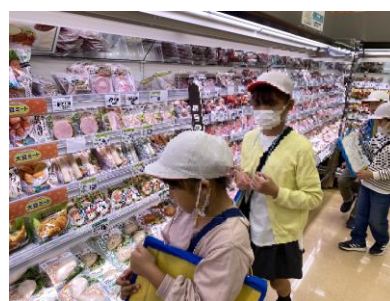
3年生校外学習（ヨークベニマル）