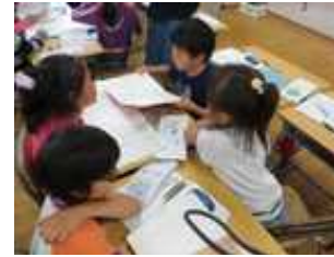
交流を取り入れた学習