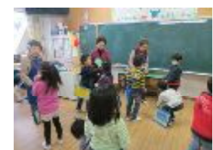
地域の方との昔の遊び