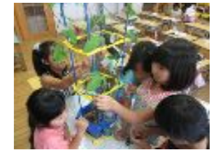
アサガオの栽培と観察