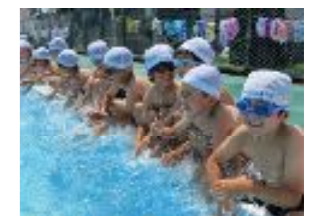
プールでの水遊び