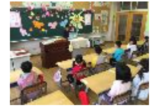
1年生と6年生の交流